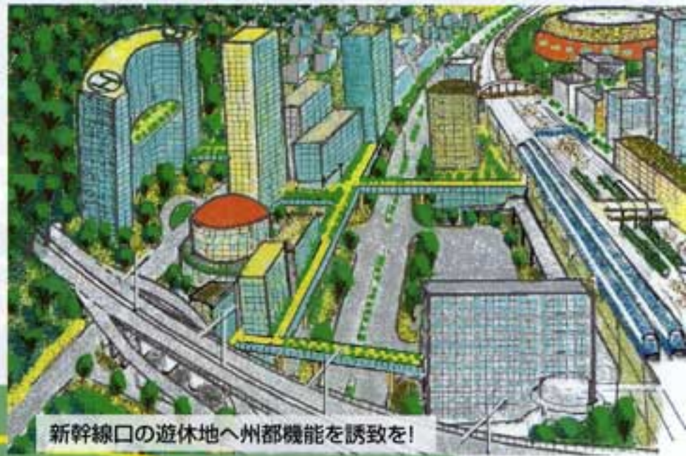
新幹線口の遊休地へ州都機能を誘致を!