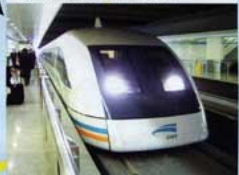
広島空港アクセスの促進

7 世界平和を主導する 広島独自のダイナミックな平和外交を、州全体で支え世界平和を主導します