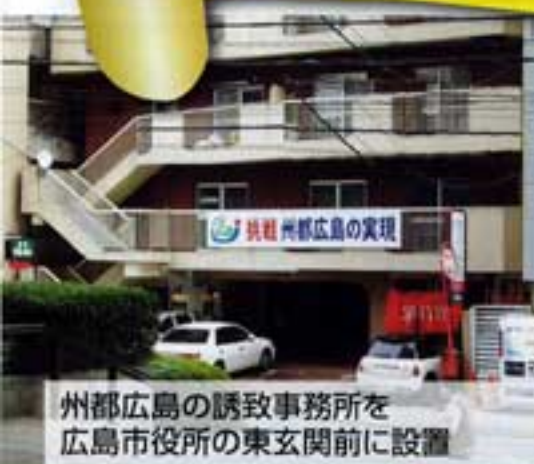
州都広島の誘致事務所を 広島市役所の東玄関前に設置