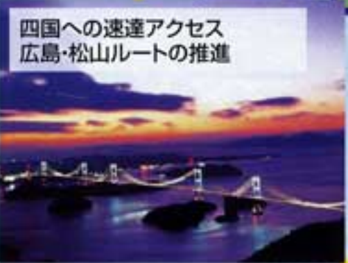
四国への速達アクセス 広島・松山ルートへの推進