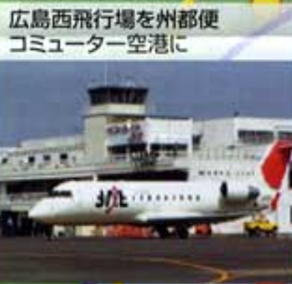
広島西飛行場を州都便 通勤ター空港に