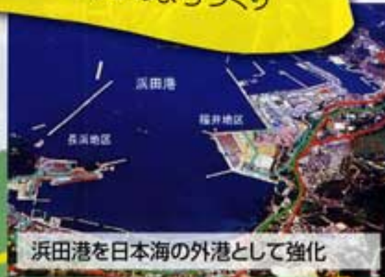
浜田港を日本海の外港として強化