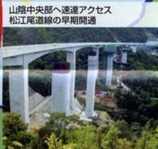
山陰中央部へ速達アクセス 松江尾道線の早期開通