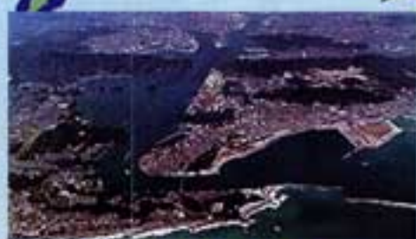
高知港を太平洋の 外港として強化